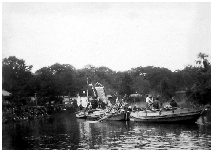
0745-3 神幸式 船上での踊り