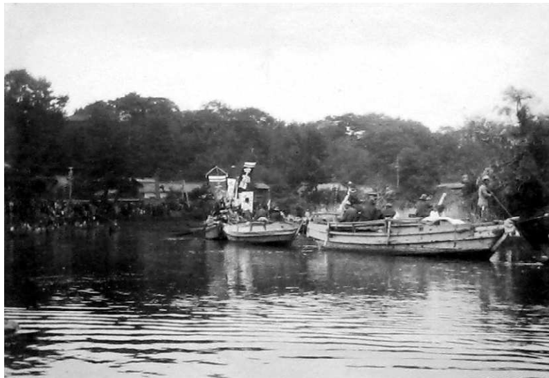
0747-1 神幸式 船行列