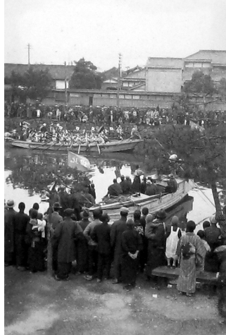
0744-4 神幸式 1929年5月12日