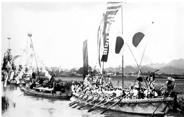
0748-3 神幸式 大橋川寄りの水路での船行列