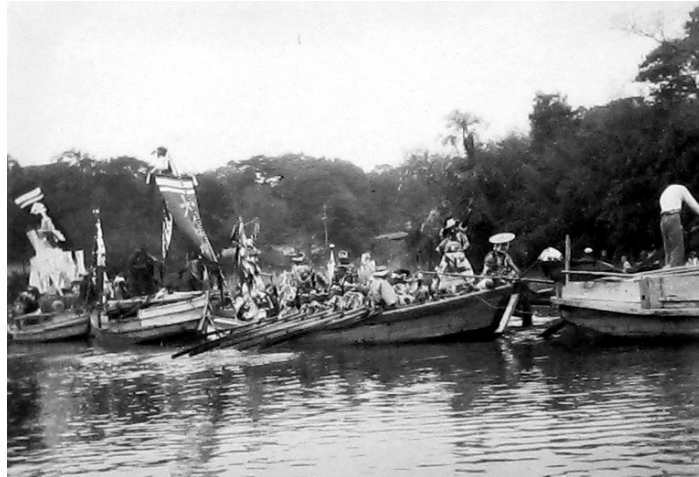
0746-4 神幸式 船行列