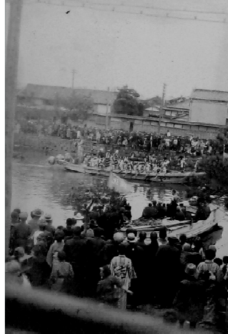
0744-2 1929年5月12出発前 の踊り手の船