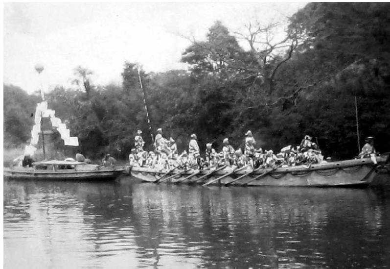
0747-3 神幸式 船行列