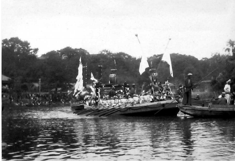
0745-4 御神輿船の前の踊り船