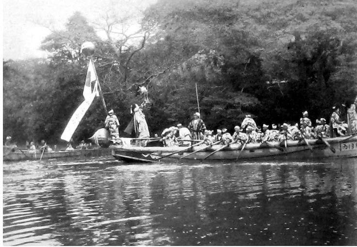
0745-2 神幸式 最初の踊り船