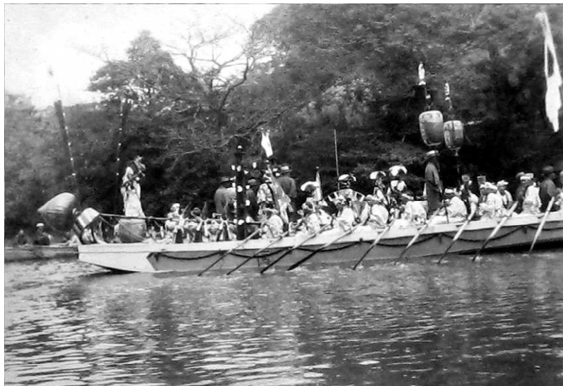
0746-1 神幸式 踊り船