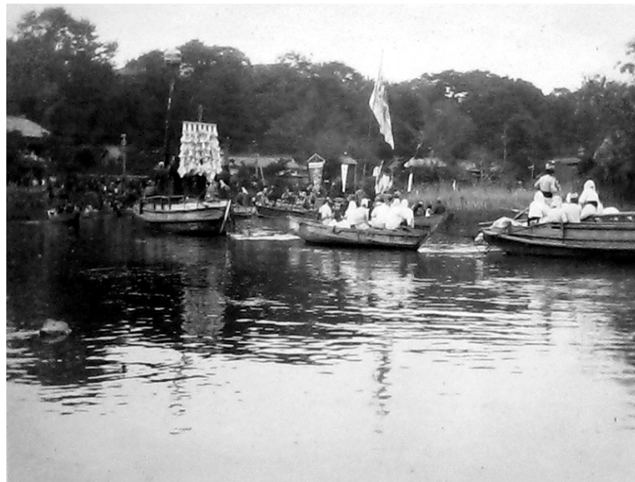
0746-3 神幸式 太鼓の船行列