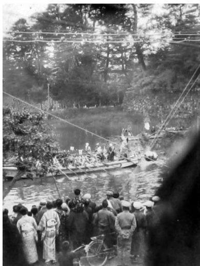
744-3-d 出発前の踊り船 1929年5月12日