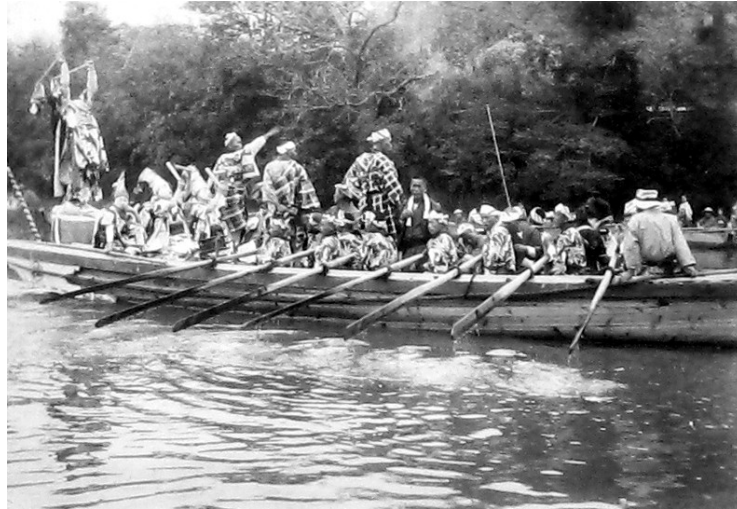
0746-2 神幸式 船行列