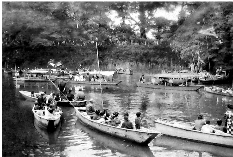
0744-1 松江の神、中海への旅程 1929年5月12日

Procession voyage of a Kami (god) of Matsue to Naka-no-umi, May 12 1929