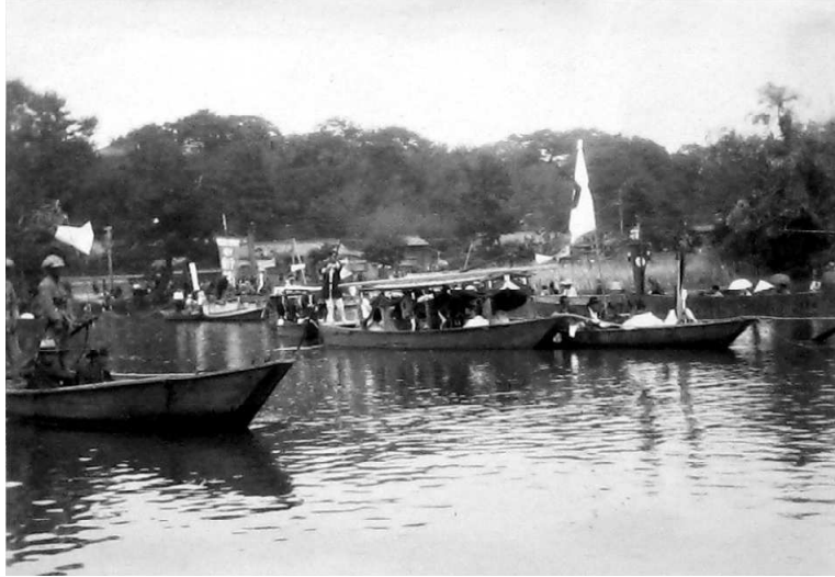
0747-2 神幸式 船行列