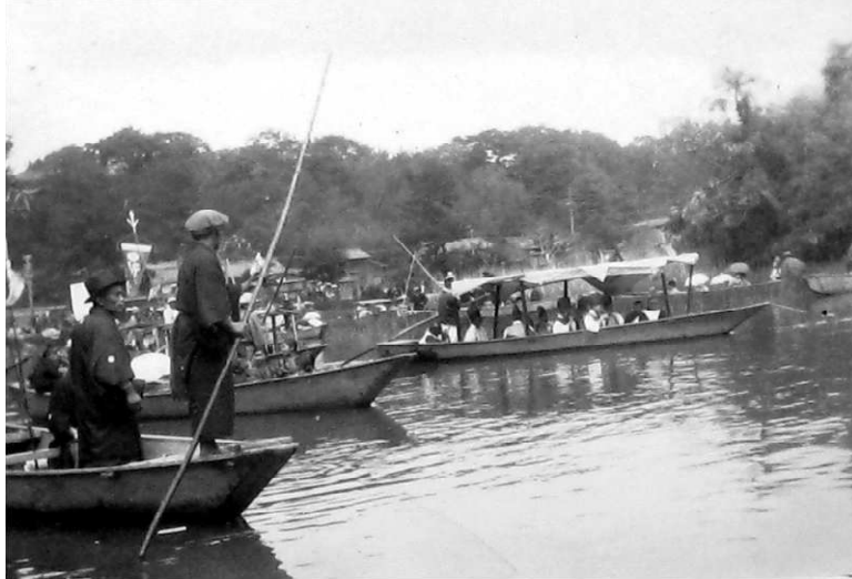
0747-4 神幸式 神官による雅楽演奏船