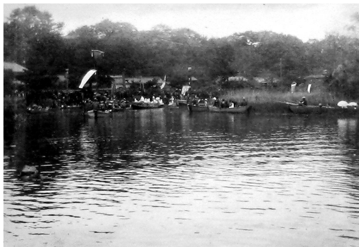
0745-1 神幸式 船行列の先頭 1929年5月12日