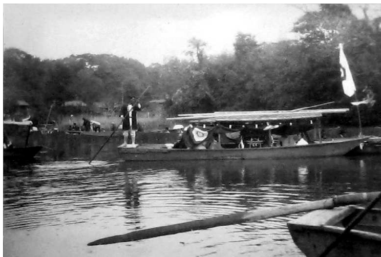
0748-1 神幸式 御神輿船